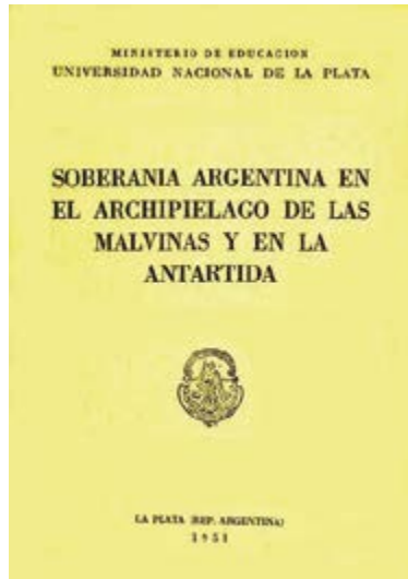
Figura 1. Reproducción de la tapa de la obra Soberanía Argentina en el Archipiélago de las Malvinas y en la Antártida .