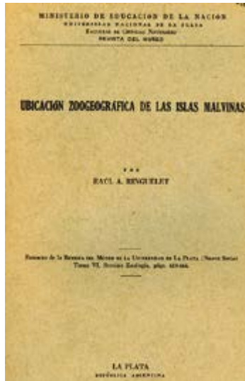
Figura 3. Reproducción de la tapa de la publicación “Ubicación zoogeográfica de las Islas Malvinas”.