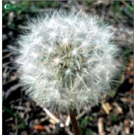
Fig. 72. Taraxacum laevigatum . A. Ilustración (Britton & Brown, 1913). B. Aspecto de la plantas. C. Infrutescencia.