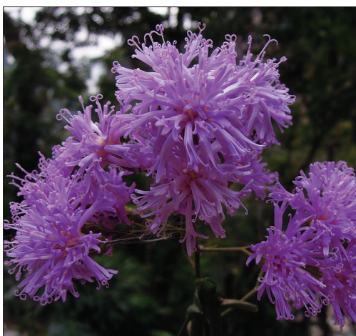
Quechualia fulta , aspecto de una planta y detalle de inflorescencia y capítulos.