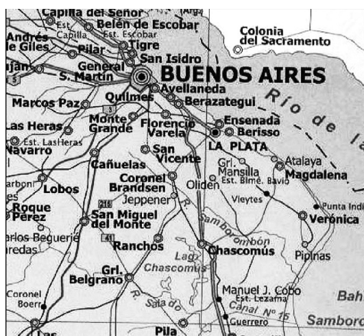
Fig. 1– Mapa de la zona de estudio.