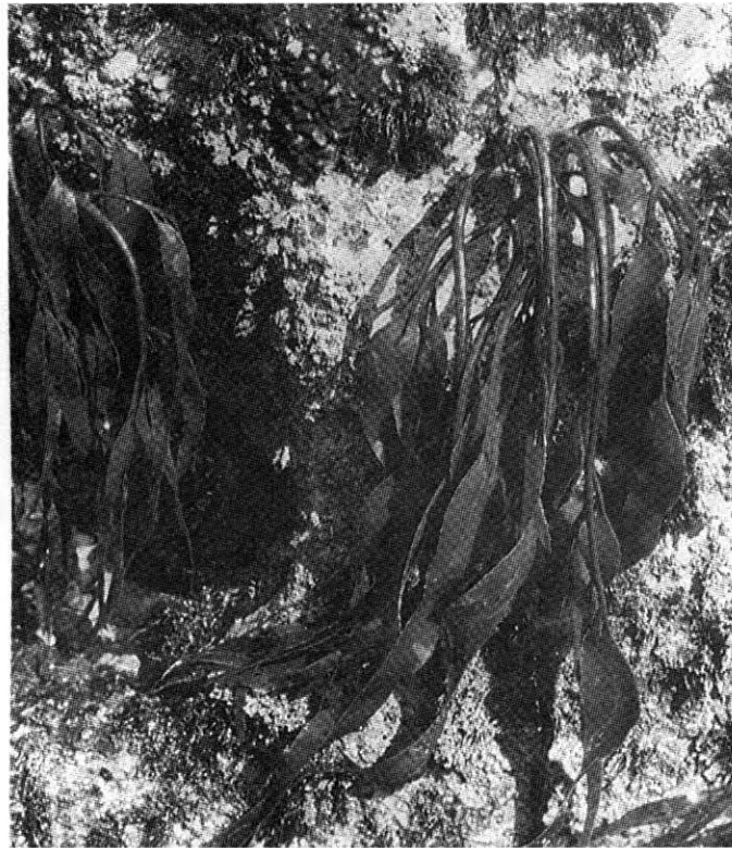
Fig. 2: Lessonia nigrescens , alga parda utilizada para la obtención de alginatos (tomado de Alveal et al., 1990).

difieren en función de la especie de que se obtiene y varían, aún en la misma especie, según la época y lugar de recolección, el estado fisiológico de la población sometida a explotación, etc.