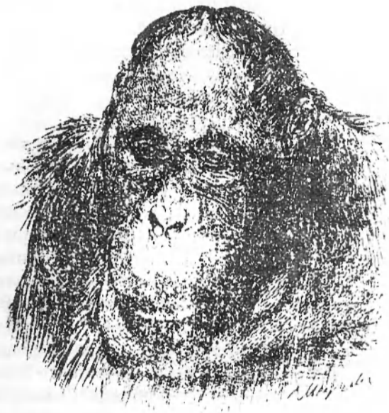
Orangután macho adulto

El concepto de población por sí mismo no introdujo cambios respecto de la caracterización disciplinaria. Aún con los trabajos serológicos de Boyd (1950) se llega a una conceptualización raciológica similar, en lo esencial, a la de Blumembach. Esto indica que si bien se produjeron cambios en la metódica, no los hubo en la metodología ni en la posición del antropólogo respecto de su realidad de estudio. Los cambios esperados se producen posteriormente, cuando el concepto de población en antropología pasa de una fase declamatoria a otra de verdadera aplicación. Aún hoy es observable declamar la "nueva posición" sin practicarla.