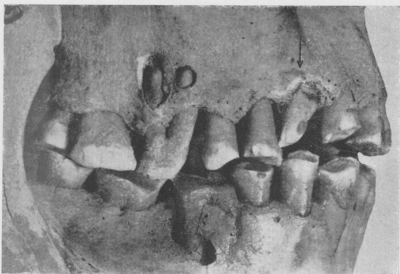
Fig. 1. — Vista lateral derecha de la dentadura del cráneo 1017. Como en la lámina anterior, la flecha señala el diente mutilado.