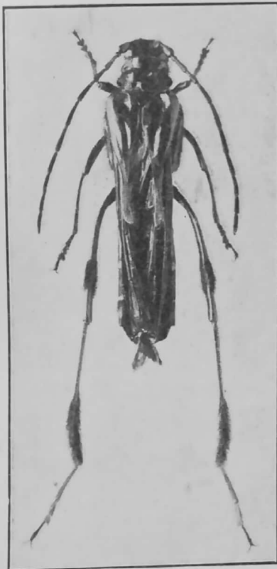
Callisphyrus semicaligatus F. et G.