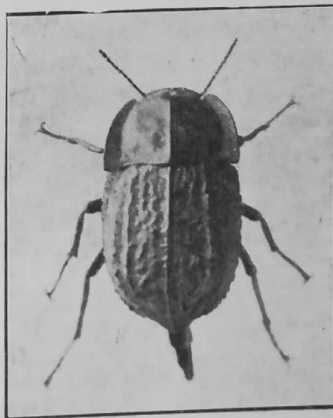
Praocis reflexicollis Sol.