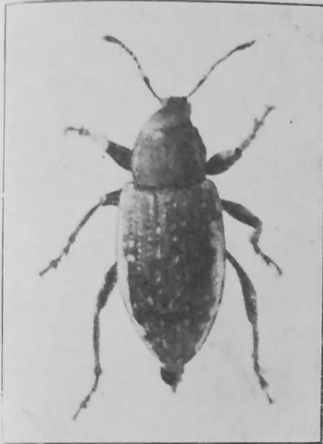
Scotoeoborus lateralis Berg