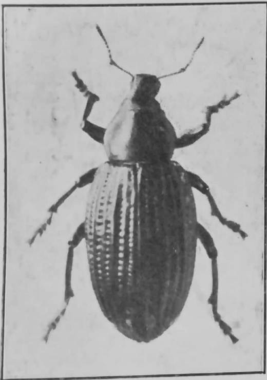
Cyliindrorrhinus sulcatus var. fuegianus Berg