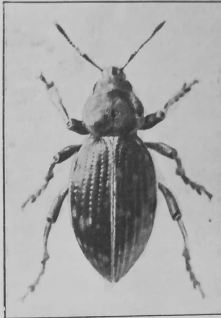
Cyliodrorrhinus tessellatus Guér.