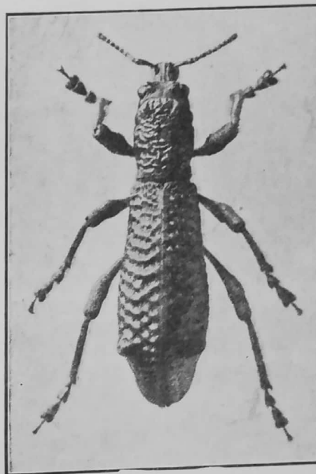
Lophotus (Aegorrh.) vitulus F.