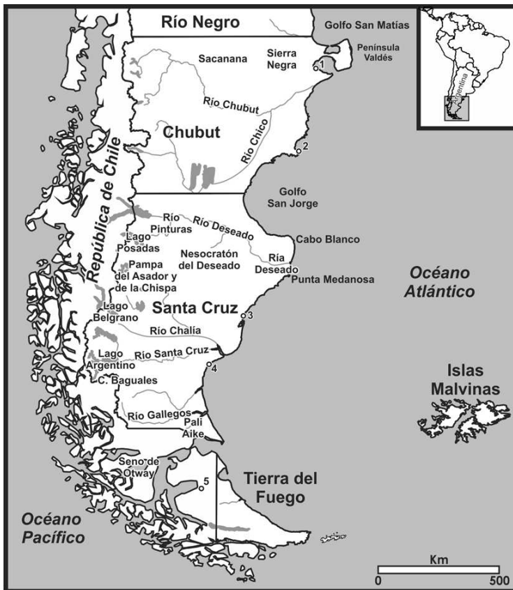
Figura 1. Ubicación de las fuentes de obsidiana, accidentes geográficos y sitios arqueológicos mencionados en el texto. Referencias: 1) Médano Grande; 2) Cabo Dos Bahías; 3) La Mina; 4) P. N. Monte León; 5) Marazzi.

(47° 50' S y 70° 59' O), representa un área de aproximadamente 15 x 80 km y se emplaza entre 1100 y 650 msnm (Figura 1). Está conformada por sedimentos fluvio-glaciares con abundantes rodados de obsidiana riolítica, basaltos y rocas silíceas presentes en superficie, principalmente concentrados en drenajes activos (Stern 1999). A 30 km al este de PDA, en un abanico aluvial y al sureste, en Pampa de la Chispa, se registran rodados de la misma obsidiana que por lo general presentan menor tamaño (Belardi et al. 2006). Hasta el momento, se ha registrado la existencia de al menos tres tipos químicamente diferenciales de obsidias de PDA (Stern 1999; 2004). Los tipos PDA I y PDAII son