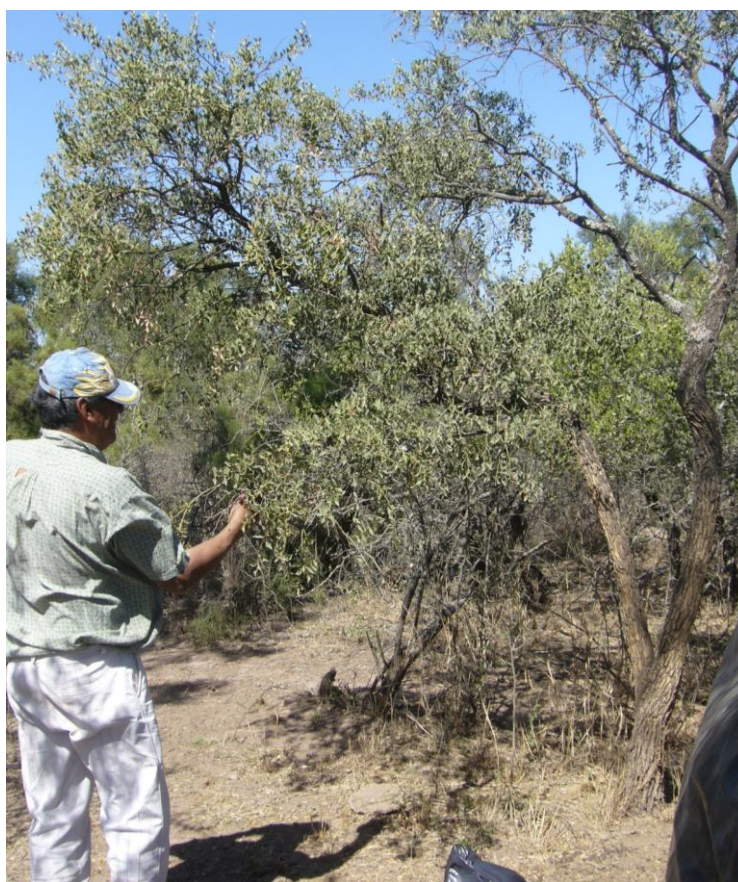
Figura 2 Caminata etnobotánica

de las plantas, los saberes relacionados a los usos de esas plantas, la vigencia de tales usos, es decir, si actualmente las seguían usando o no, y en algunos casos se indagó sobre formas de uso o partes de las plantas utilizadas. Finalizada esta etapa inicial del trabajo, se procedió, en los viajes siguientes, a la aplicación de entrevistas abiertas y semiestructuradas para indagar sobre aspectos específicos, como vigencia del uso, partes de las plantas utilizadas, formas de preparación y administración. Para esto se utilizaron fotos de visitas anteriores y tablas con nombres locales de plantas y en algunos casos se realizaron nuevas caminatas.