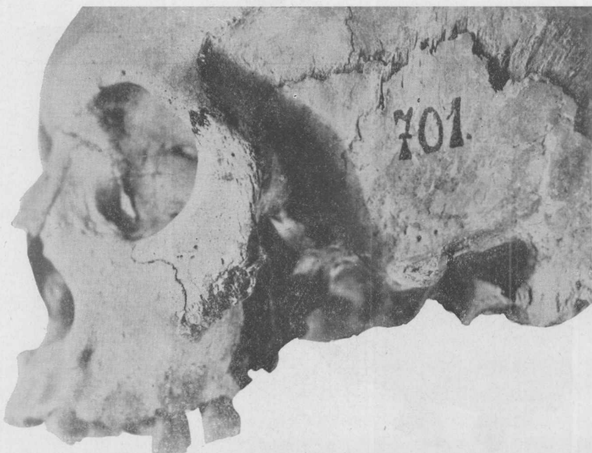
Trofeos con ablación de malar, a \frac{1}{1}